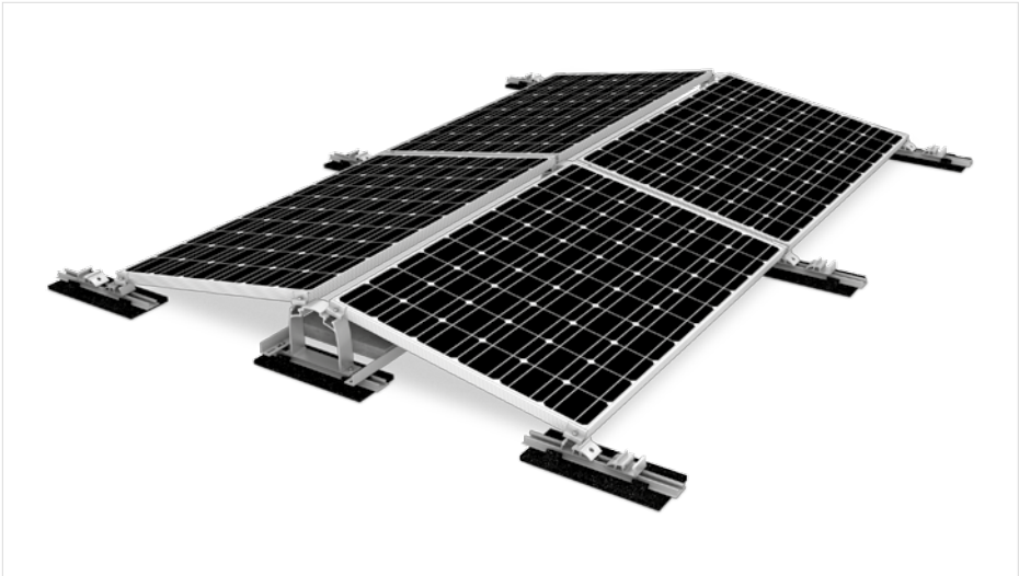
Zusätzliche Ballastierungsmöglichkeiten mittels K2 Short Porter seitlich oder K2 Porter mittig