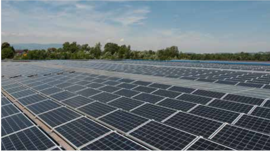
Slowenien Anlage: 150 kW | S-Dome System