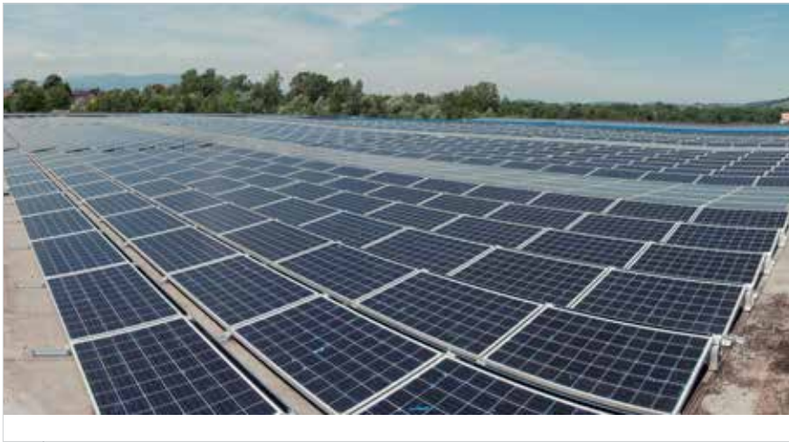
Slowenien Anlage: 150 kW | S-Dome System